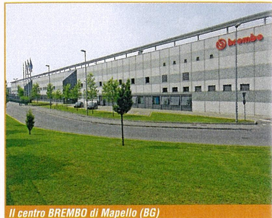
Il centro BREMBO di Mapello (BG)